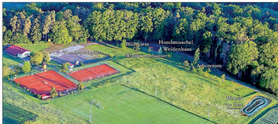
Luftbild vom TREFFPUNKT NATUR

Das wird alles Schritt für Schritt erfolgen. Und zum guten Ende soll ein großes Biotopüberraschungseinweihungsfest mit dem ganzen Dorf gefeiert werden.